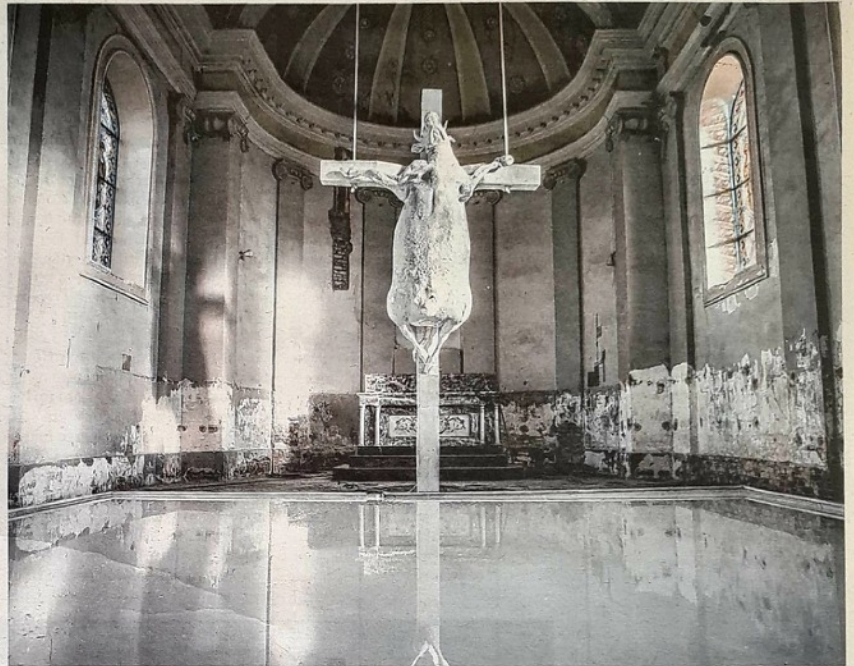
Holy Cow in de kerk van Kuttelkoven, drie jaar geleden.